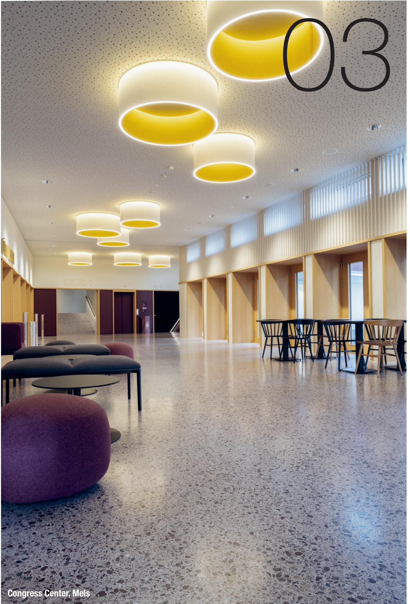
Congress Center, Mels