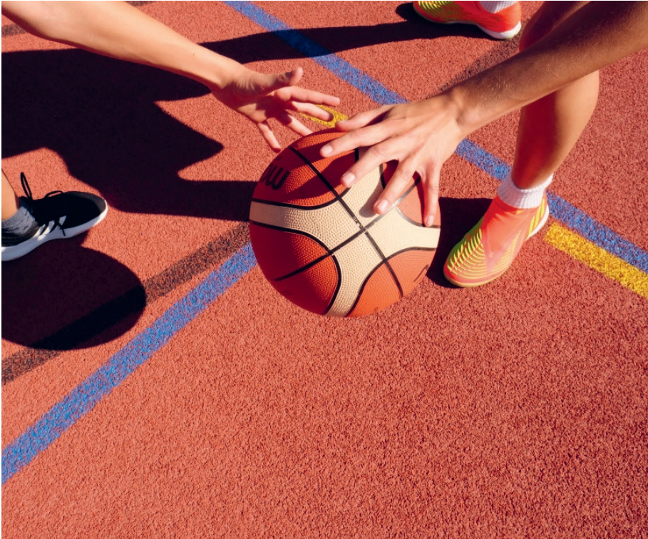
Sports field, Buchs

Our floors and walls have been developed for a wide variety of needs. The variety of WALO floor and wall coverings impresses with its numerous design and functional options. The surfaces can be individually adapted to your needs and are therefore suitable for a wide range of applications.