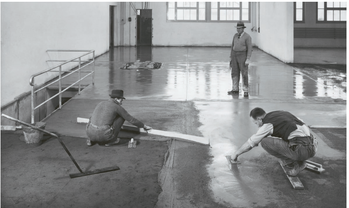
Nova-Werke, Zurich Hard concrete flooring 1938