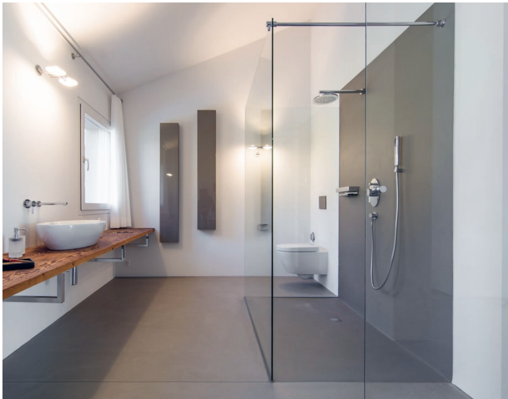
Attic apartment, Gais